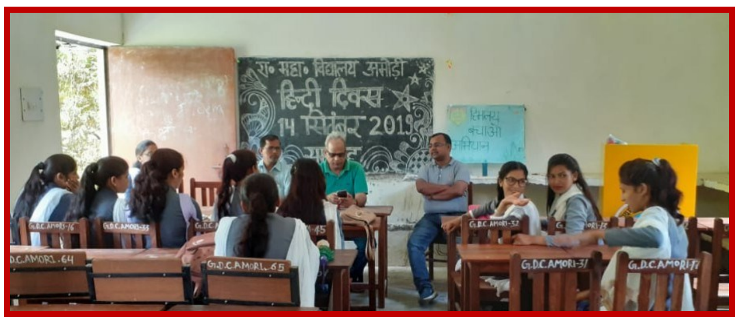
Hindi Diwas Celebration: 14Sep-2019