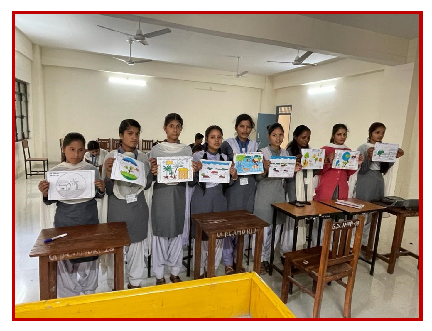
Green India Awareness Programme in College 2023