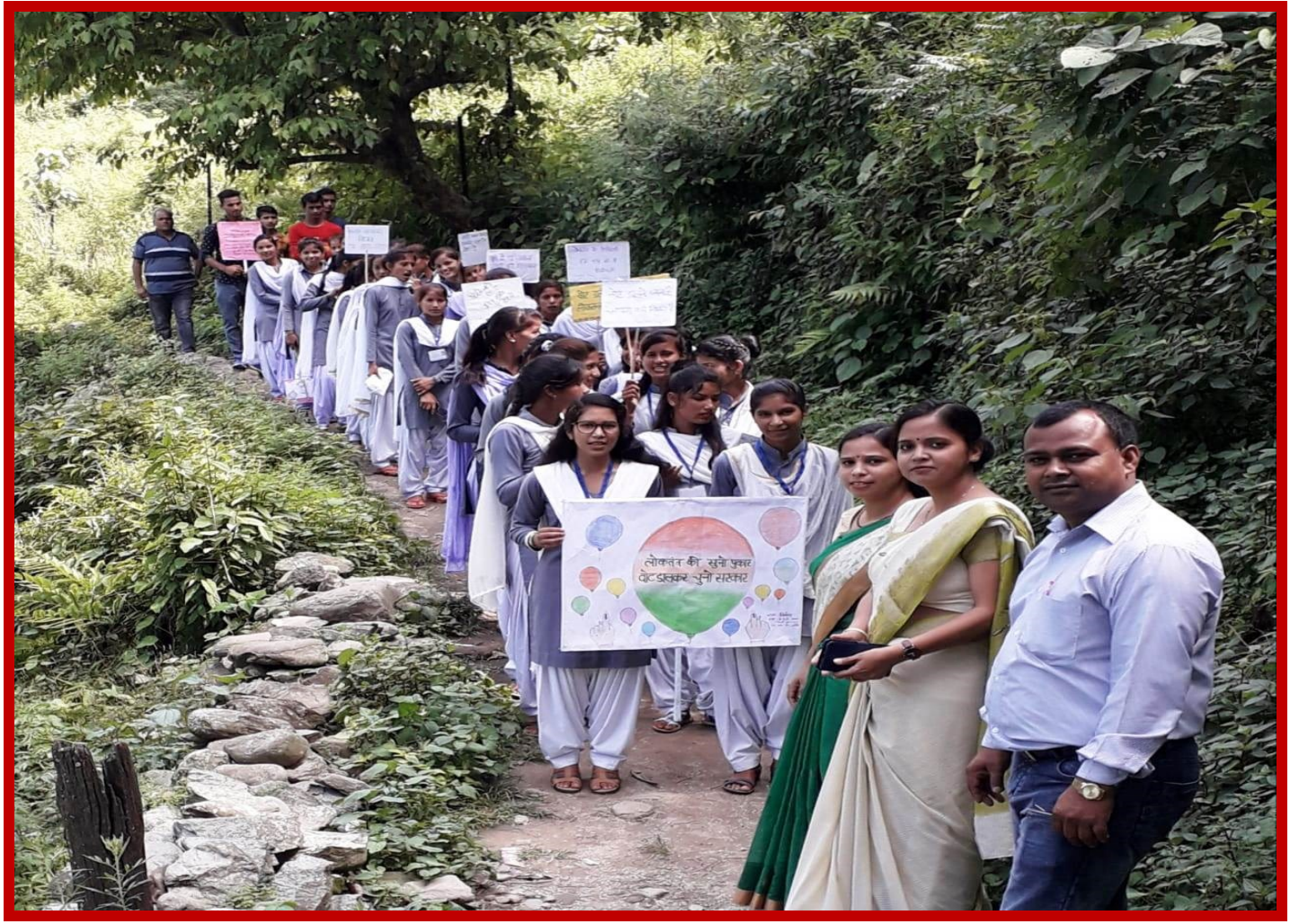
Voter Awareness Rally: 2021-22