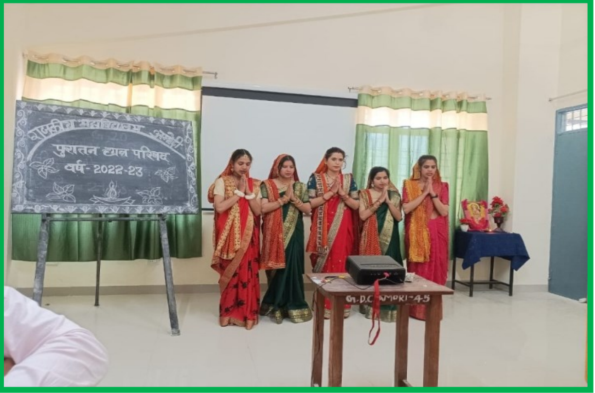
Alumni Meet 2022-23