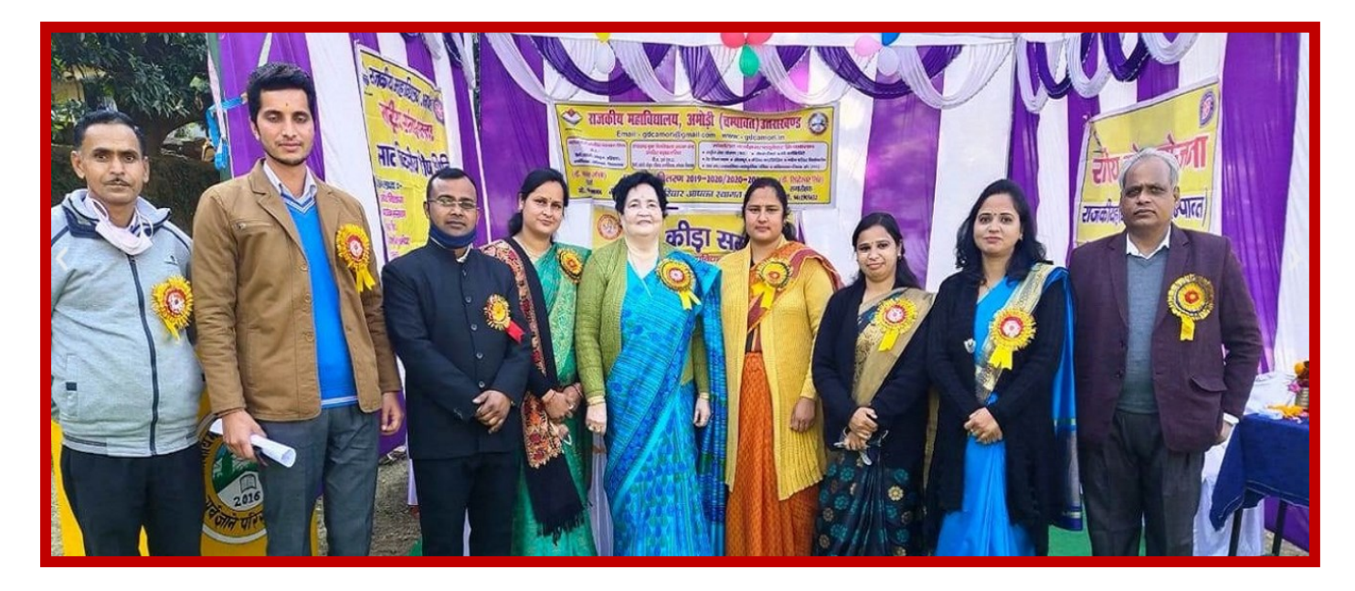
Annual Games function celebration: 2020

The main language of Uttarakhand is Hindi. Here most of the government work is done in Hindi. Hindi is spoken in urban areas. Kumaoni is spoken in the rural areas of Kumaon division and Garhwali is spoken in the rural areas of Garhwal division. Devanagari script is used to write Kumaoni and Garhwali languages. College follow the all culture of Kumauni