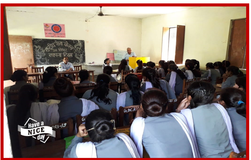
NSS Foundation Day Celebration 24 September 2019