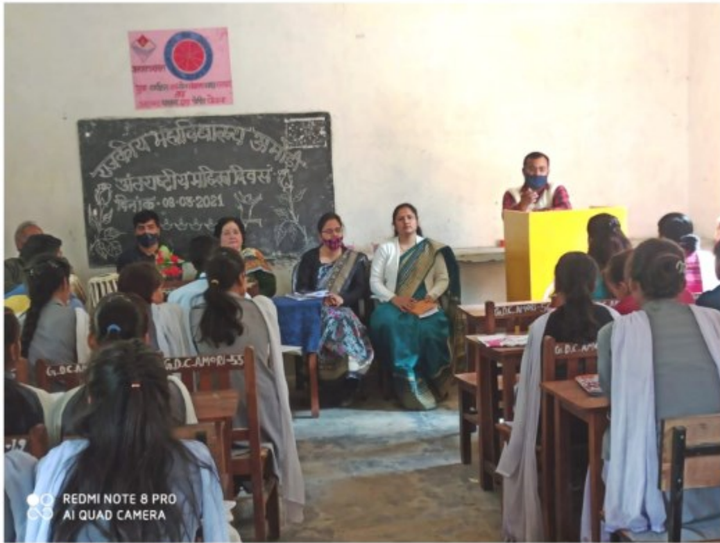
INTERNATIONAL WOMEN DAY : DATE 18-03-2021