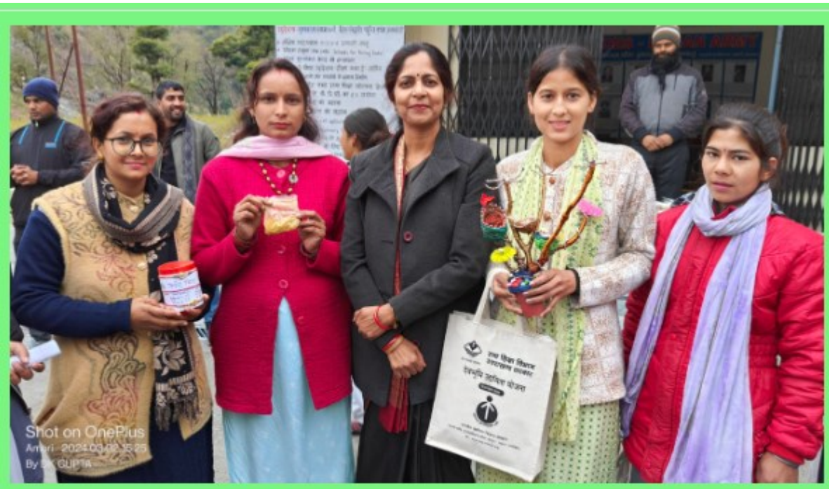
Female EDP participants with her hand made items for future shaper