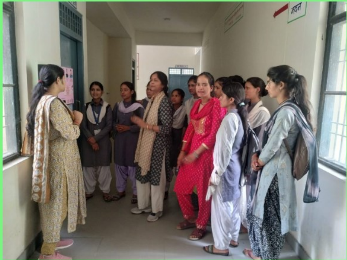
Sanitary Pad Vending Machine For College Female Students