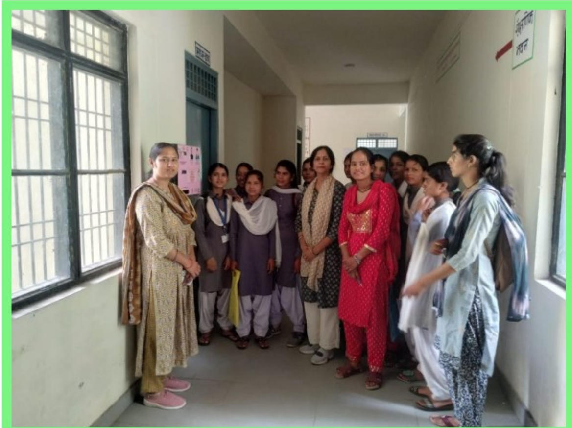
Sanitary Pad Vending Machine For College Female Students