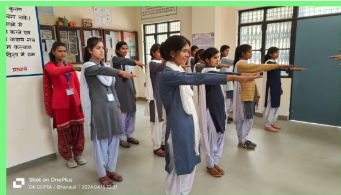
College Girls taking the pledge of protect my dignity and self-respect.