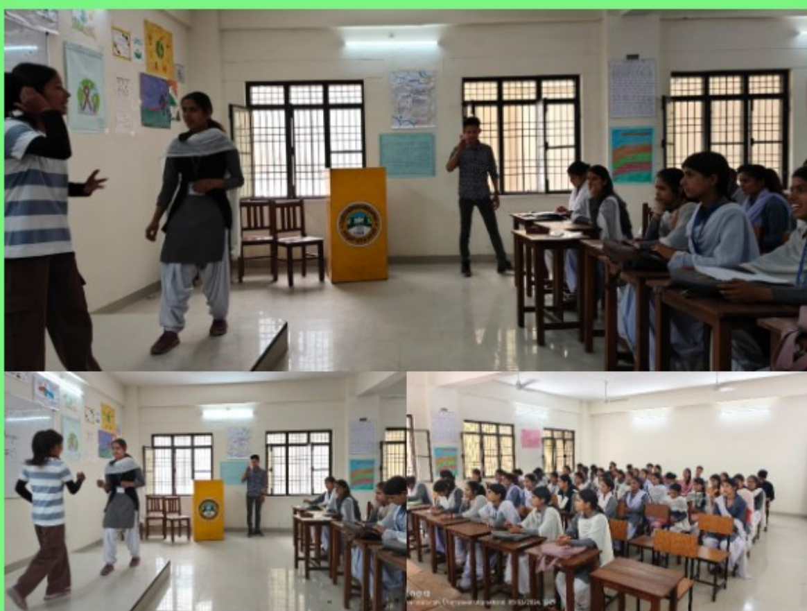
FEMALE STUDENTS SELF DEFENCE TRAINING ON 03MAY 2024

बेटी बचाओं, बेटी पढ़ाओं अभियान के अन्तर्गत उत्कृष्ट कार्य हेतु महिला सशक्तिकरण एवं बाल विकास विभाग कैबिनेट मन्त्री श्रीमती रेखा आर्या द्वारा प्राचार्य, राजकीय महाविद्यालय अमोड़ी को पुरस्कृत व सम्मानित किया गया। दिनांक 07 मार्च 2024