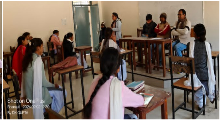
Shot on OnePlus Bhanauli 2024.02.02 12:30