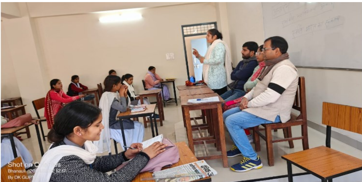
Shot on OnePlus Bhanauli 2024.02.02 12:07