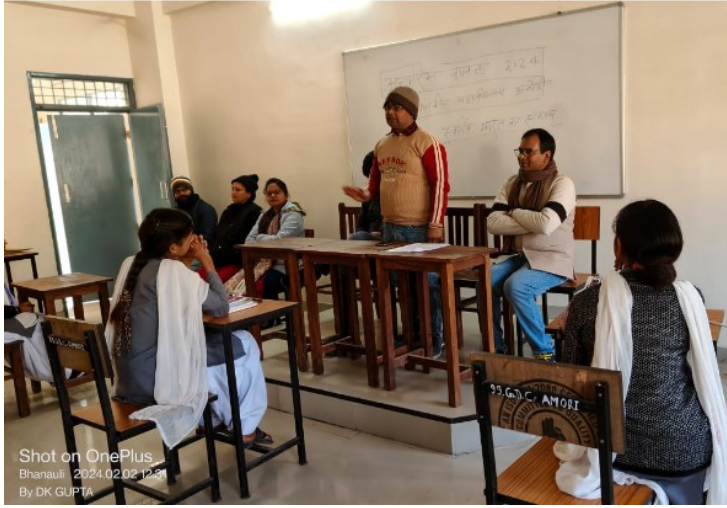
Shot on OnePlus Bhanauli 2024.02.02 12:21