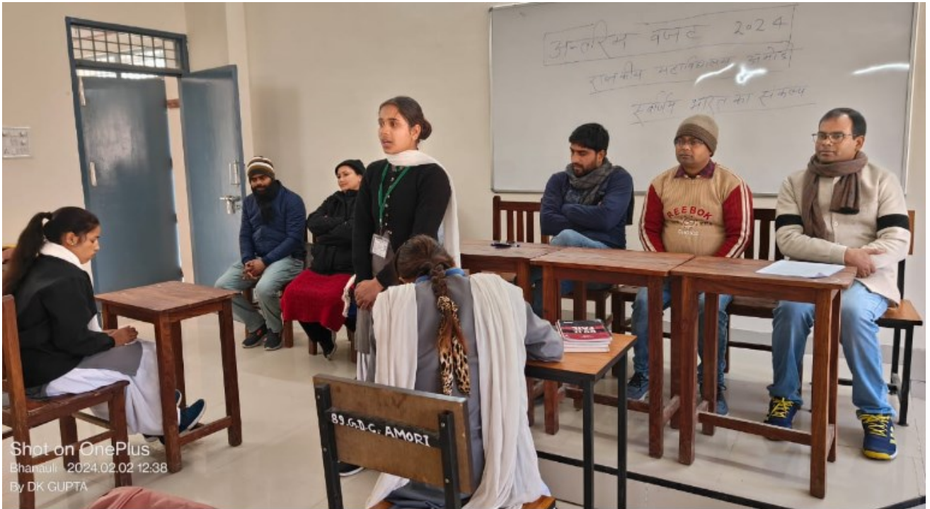
Shot on OnePlus Bhanauli 2024.02.02 12:38