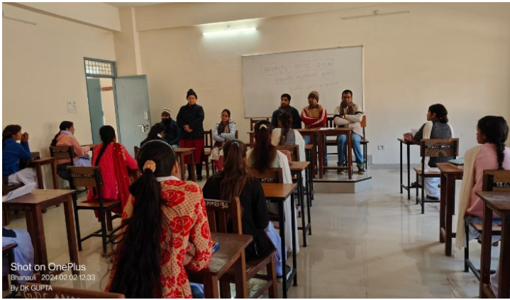
Shot on OnePlus Bhanauli 2024.02.02 12:33