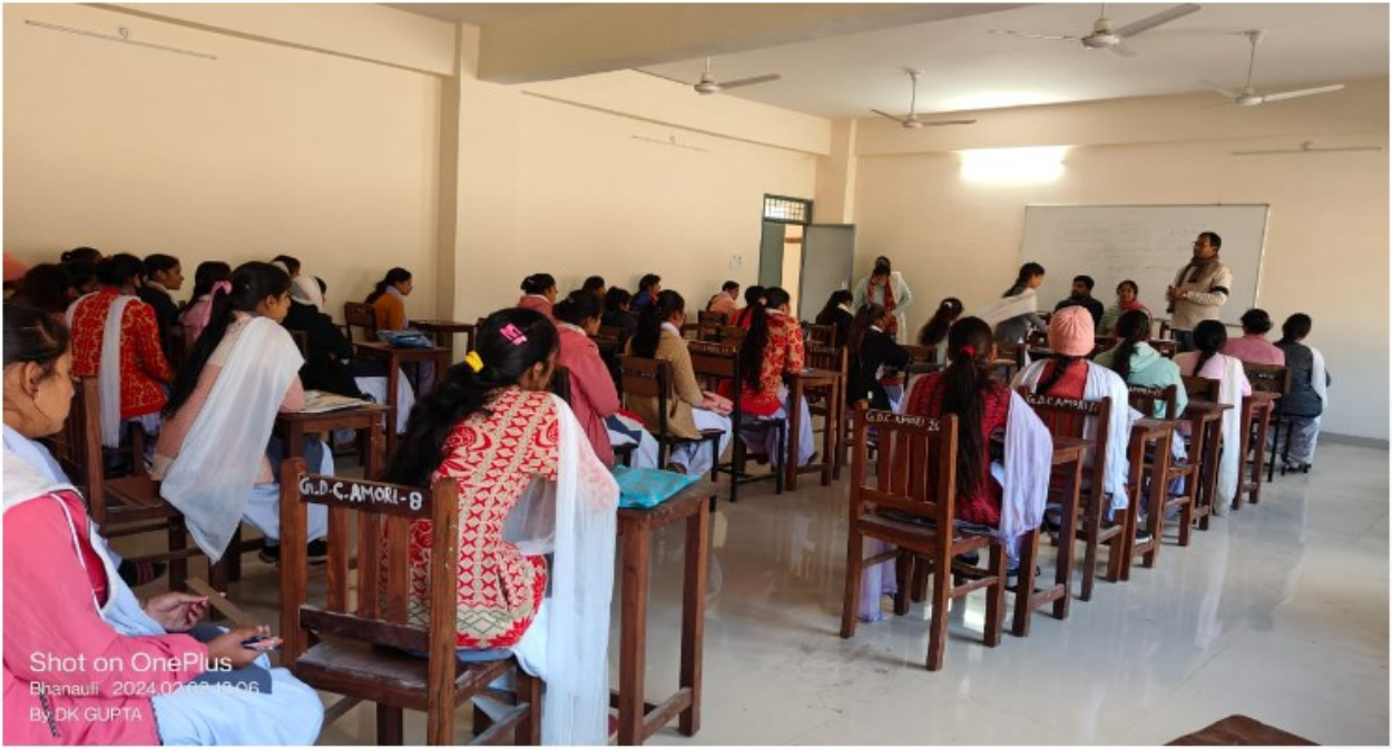
Shot on OnePlus Bhanauli 2024.02.02 12:06