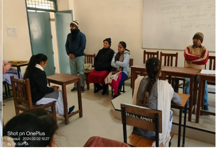
Shot on OnePlus Bhanauli 2024.02.02 12:27